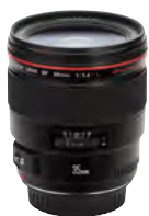
Objektivi fiksne žarišne duljine

Ovisno o tipu objektiva - na primjer, fiksni, zum ili objektivi sa nagibom i pomakom - Canonovi EF objektivi uobičajeno ističu serijske brojeve na kućištu objektiva, ili ugravirane na elektroničkom priključku (bajonetu) objektiva.