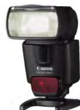
Speedlite 580EX II i 430EX II bljeskalice

Prethodne generacije Canon Speedlite bljeskalica - 580EX i 430EX - svoje serijske brojeve imaju ugravirane na glavi bljeskalice bez ikakvog obojenja.