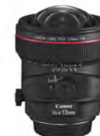
Objektivi s nagibom i pomakom

Canonovi EF zum objektivi imaju svoje serijske brojeve ugravirane u elektronski priključak ili na kućištu objektiva. Uobičajeno su crnoj boji.