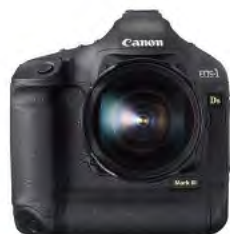
EOS-1Ds Mark III

Serijski brojevi na EOS-1 seriji DSLR fotoaparata, kao što je EOS-1Ds Mark III i EOS-1D Mark IV, razlikuju se od serijskih brojeva na ostalim EOS modelima zato što ispred nemaju oznaku "NO" i prikazani su u nizu bijelih brojeva.