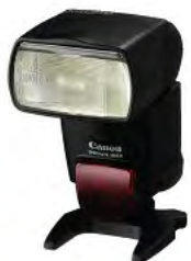
Speedlite 580EX i 430EX bljeskalice

Ovisno o starosti vaše Speedlite bljeskalice - stariji model ili Mark II jedinice - serijski brojevi su označeni na različit način. Serijski brojevi su ili ugravirani u bljeskalicu (stariji modeli) ili prikazani na naljepnicama na novijim modelima, kao što je 580EX II.