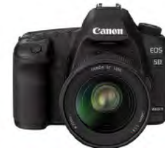
EOS 5D Mark II

Serijski broj EOS 50D fotoaparata postavljen je na podložnu pločicu fotoaparata (podnožje). Serijski broj uobičajeno se prikazuje crnim slovima u srebrnom okviru.